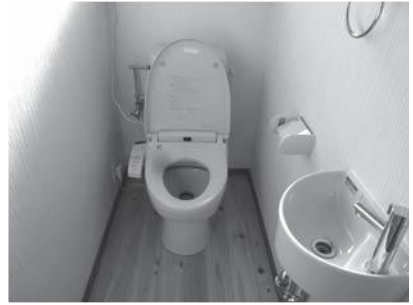
改修は、台所やトイレを重点的に…