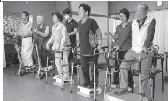
通所型短期集中運動機能向上サービスでは、講話や器具を使つての介護予防を(デイサービスセンター浮輪)