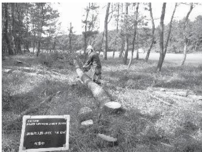
伐倒による松食い虫防除