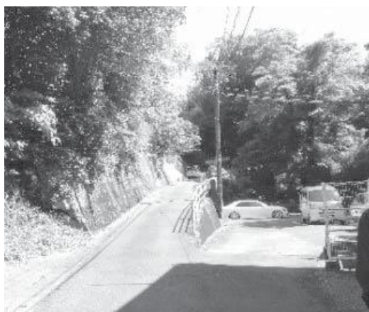
避難道整備予定地