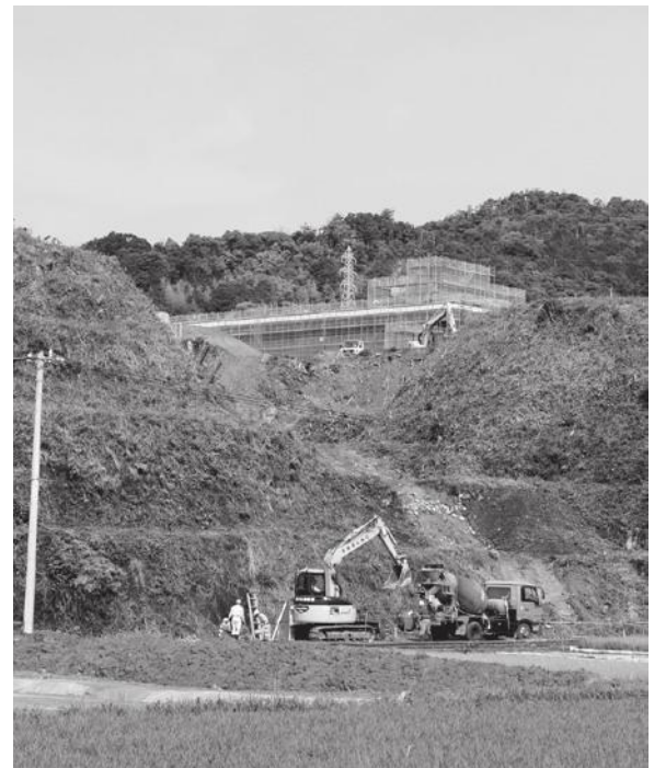
新庁舎をバックに工事中の2号調整池 (6月下旬、サンシャイン大方裏より望む)