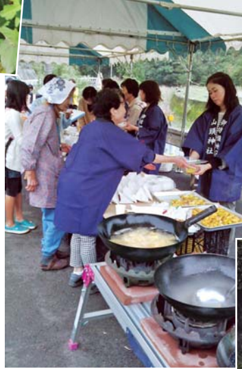
▲「地域の秋を楽しむ会」には地区からの出店も

また、地区の事業としては、毎年11月に馬荷や橘川地区とによる「かきせ川地域づくり協議会」により、「地域の秋を楽しむ会」を開催しているとのことでした。