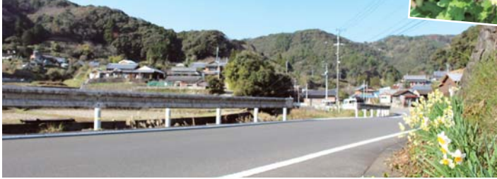
▲蛸瀬川沿いの御坊畑地区。沿道にはさまざまな草花が(上2枚)