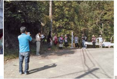
◀ 「楽しむ会」ウォーキングの「コマ