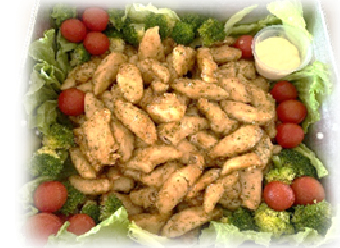
たの かいしよく なか 楽しく会食♡お腹いっぱい♡