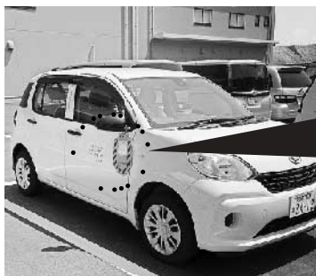
ミラーズロックの状況