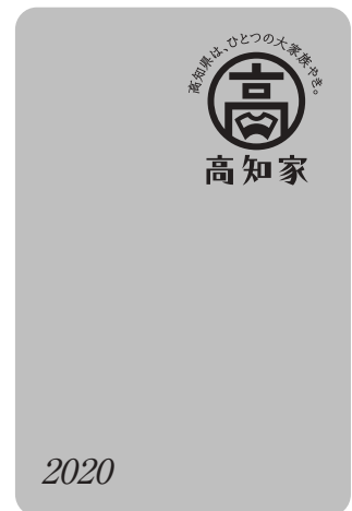
カバーの色：アイ色