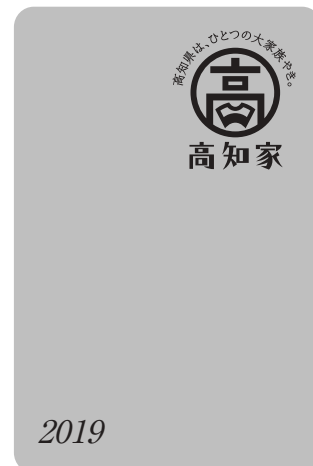
カバーの色：ナイルグリーン