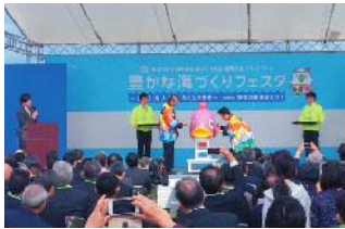
平成27年度の福岡大会の プレイベントの様子

本大会は、水産資源の保護管理と海や湖沼・河川の環境保全の大切さを広く発信するとともに、つくり育てる漁業の推進を通じて漁業の振興と発展を図ることを目的として、毎年各県で開催されています。 本県では、平成30年秋季に開催が決定し、式典行事（高知市文化プラザかるぼーと）での功績団体表彰や、海上歓迎・放流行事（宇佐しおかぜ公園）での稚魚の放流に加え、県民の皆さんに「参加いただける「関連行事」（高知市内会場を予定）の開催を計画しています。 また、今年度は、大会に向けた機運醸成や、大会開催をきっかけとして水産業の振興と環境保全の大切さを広く県民の皆さんに知っていただくため、県内の様々なイベントへのブース出展も行っていきます。