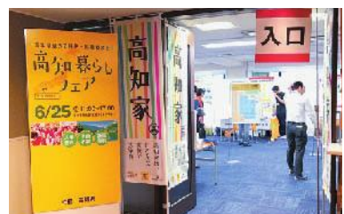
高知暮らしフェアin東京