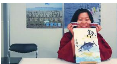
ブース訪問者に防災缶詰プレゼント