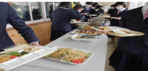
この教室で給食を食べるのも残りわずかとなったこの日。 最後の給食まであと3日でした。