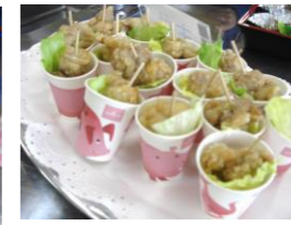
ハンバーグとからあげのリクエストが多 かったです！