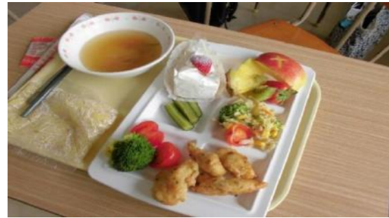
ラーメンも人気がありました☆