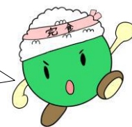
黒潮町食育キャラクター