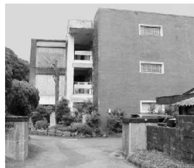
〔旧佐賀中学校正門付近〕