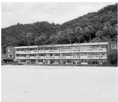
〔旧佐賀中学校校舎全景〕

昭和42年10月29日に統合中学校として落成して以来、43年の間、佐賀の子どもたちが通った学び舎が新しくなります。